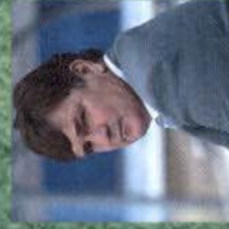
JOSÉ ANTONIO CAMACHO Entrenador Nacional